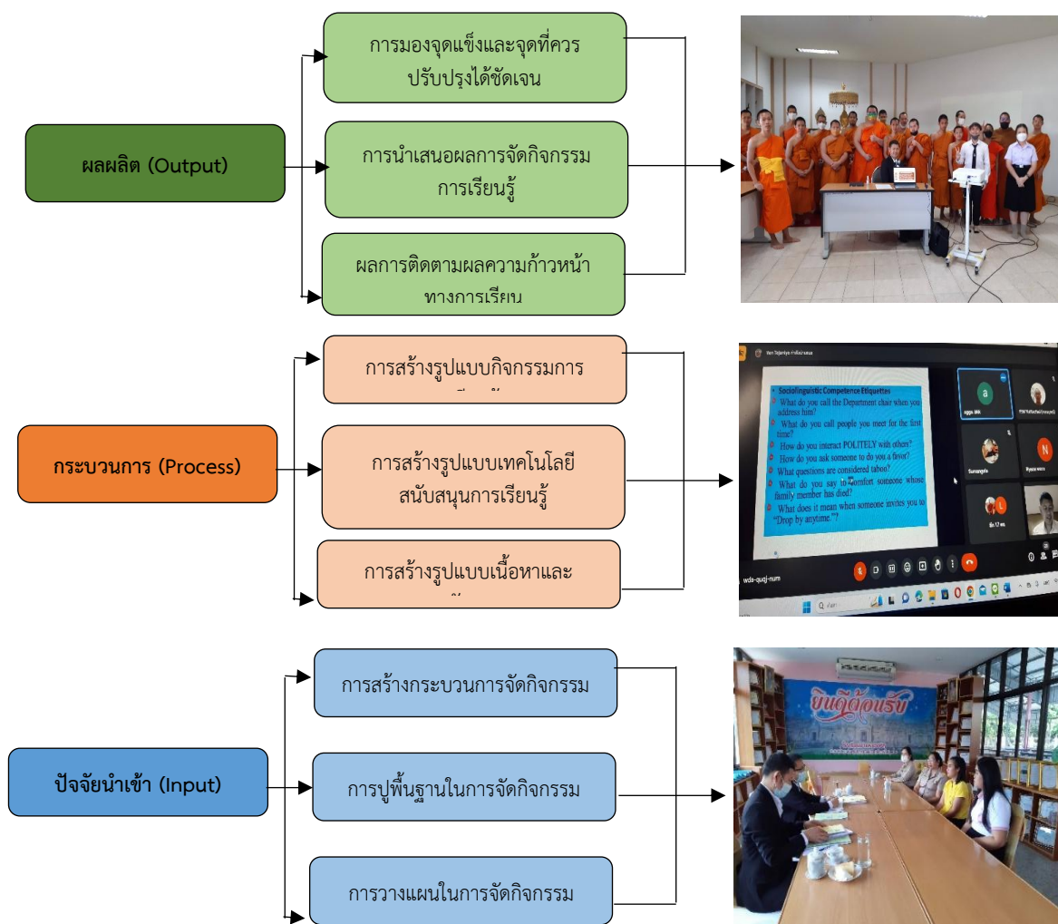
แผนภาพที่ 2 แสดงขั้นตอน กระบวนการ สังเคราะห์จัดรูปแบบการจัดการเรียนในการพัฒนาห้องเรียนพระพุทธศาสนาภาคภาษาอังกฤษอัจฉริยะเพื่อส่งเสริมการเรียนรู้ตลอดชีวิต

ผลการวิจัย พบว่า ส่วนของเนื้อหาและหลักสูตร ไม่ได้เน้นแต่ภาษาหรือหลักธรรมแยกกัน ระบบเรียนรู้แบบรวมศูนย์ มีทั้งวิดีโอเสียง ภาพประกอบ และแบบฝึกในทีเดียวกัน กิจกรรมการเรียนรู้จะเน้นที่การฝึกสนทนาและเข้าใจคำศัพท์เชิงพุทธ และ ติดตามพัฒนาการของผู้เรียนอย่างละเอียด โดยมีกระบวนการตามแผนภาพ ประกอบด้วย 1) กระบวนการจัดกิจกรรม เพื่อการถอดประสบการณ์เกี่ยวกับการพัฒนาห้องเรียนพระพุทธศาสนาภาคภาษาอังกฤษอัจฉริยะเพื่อส่งเสริมการเรียนรู้ตลอดชีวิต 2) การจัดประชุมกลุ่มเพื่อถอดประสบการณ์ และแลกเปลี่ยนการเรียนรู้ และ 3) นำไปสู่แนวทางการจัดการเรียน โดยมีการเก็บข้อมูล การถอดประสบการณ์ และการนำไปสู่การจัดการเรียน ตามแผนภาพดังนี้