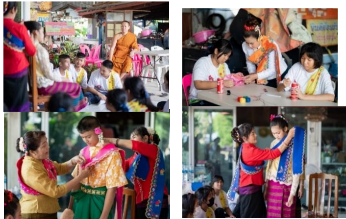
ภาพที่ 2 ผ้าสไบมอญหรือที่ชาวมอญเจ็ดริ้วเรียกว่า หลญาตสะเหริมโตะ

ผลการวิจัย พบว่า ประเพณีสไบมอญและการแต่งกายในชุมชนตำบลเจ็ดริ้ว ซึ่งผู้วิจัยเห็นว่าเยาวชนในชุมชนตำบลเจ็ดริ้ว ได้ลงพื้นที่ในการทำกิจกรรม การปักสไบมอญ บ้านปลายคลองพาดหมอนตำบลเจ็ดริ้ว อำเภอบ้านแพ้ว จังหวัดสมุทรสาคร โดยมีปราชญ์ผู้ให้ความรู้ด้านการปักสไบมอญให้ความรู้กับเยาวชน ผ้าสไบมอญอัตลักษณ์ไทยรามัญหรือที่ชาวมอญทั่วไปเรียกว่า หลญาต สะเหริมโตะ หรือ หลญาตสะเหมินโตะ ซึ่งน่าจะหมายความถึง ผ้าที่มีลวดลายพัฒนามาจากลายของโตกโดยคาดว่า หลญาต หมายถึง ผ้า สะเหริม หมายถึง ขอบซึ่งผ้าสไบมอญ เป็นเครื่องแต่งกายแสดงเอกลักษณ์ของชาวมอญ ซึ่งความเป็น จะเห็นได้ว่า ชาวมอญจังหวัดสมุทรสาครบ่งบอกตัวตน บ่งบอกวิถี บ่งบอกชาติพันธุ์สะท้อนผ่านการปักผ้าสไบด้วยรูปแบบลวดลายดอกพิกุล และลายดอกจันทร์ล้อมรอบดอกพิกุล ที่ใช้หม้อมายเข้าวัดหรือในพิธีสำคัญหลญาตสะเหริมโตะ ของทางสมุทรสาครใช้ได้ทั้งชายหญิง โดยเฉพาะในวัยหนุ่มสาว ส่วนชายสูงอายุมักใช้ผ้าขาวม้ามากกว่า ขนาดของหลญาตสะเหริมโตะ กว้างประมาณ 1 ศอก ยาวประมาณ 4 ศอก ปักลายดอกไม้ตรงริมผ้าตลอดทั้งผืน ลายดอกสอดสลับสีสวยงามตัดกับสีพื้นของผืนผ้า ที่นิยมสีสดใส เช่น แดง ส้ม เขียวทองอ่อน เหลือง ขาว ฟ้า ชมพู และนับเป็นงานฝีมือของลูกผู้หญิงมอญอย่างหนึ่งที่จะต้องลงมือทำด้วยตนเองทุกคน ทุกครัวเรือน สไบใช้ได้ทุกเพศทุกวัย ใส่ไปทำบุญที่วัดตอนเช้า หรือจะแต่งตัวตามวันสำคัญๆ ด้วยความนิยมทำให้ชาวมอญเจ็ดริ้วนำอัตลักษณ์การทำสไบมายกระดับพัฒนาผลิตภัณฑ์สร้างรายได้สู่ครัวเรือน และพัฒนาเศรษฐกิจระดับชุมชนให้เกิดความยั่งยืน โดย OTOP สมุทรสาคร ได้มาทำเรื่องราวของสไบมอญเจ็ดริ้ว