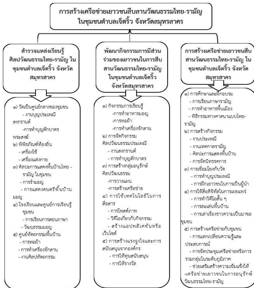
ภาพที่ 3 องค์ความรู้ที่ได้จากการวิจัย

3.5 การสร้างเครือข่ายกับชุมชน ซึ่งเป็นชุมชนไทย-รามัญที่อยู่ในพื้นที่ใกล้เคียงหรือจังหวัดอื่น ๆ เพื่อแลกเปลี่ยนความรู้และประสบการณ์ การจัดประชุมเครือข่ายหรือการรวมกลุ่มในระดับภูมิภาคจะช่วยเสริมสร้างความเข้มแข็งให้กับเครือข่ายเยาวชนในการอนุรักษ์วัฒนธรรมไทย-รามัญ