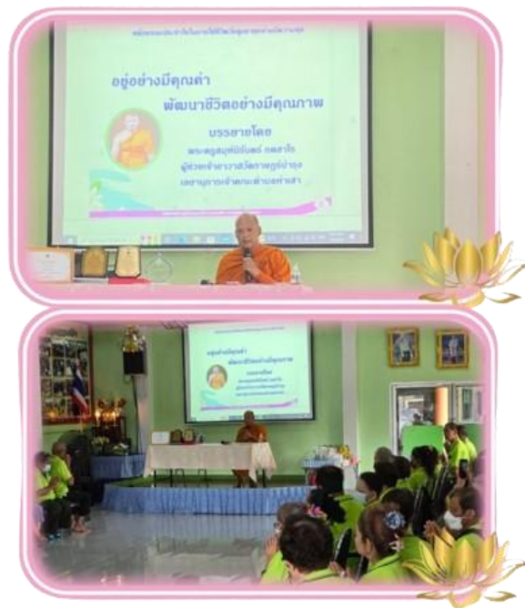
ภาพที่ 3 การให้ความเข้าใจในการดำเนินชีวิตแก่ผู้สูงอายุ