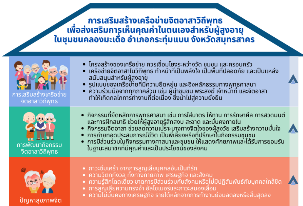
ภาพที่ 4 องค์ความรู้ที่ได้จากการวิจัย

องค์ความรู้ที่ได้จากการวิจัย “การเสริมสร้างเครือข่ายจิตอาสาวิถีพุทธเพื่อส่งเสริมการเห็นคุณค่าในตนเองสำหรับผู้สูงอายุในชุมชนคลองมะเดื่อ อำเภอกระทุ่มแบน จังหวัดสมุทรสาคร” มีรายละเอียดดังนี้