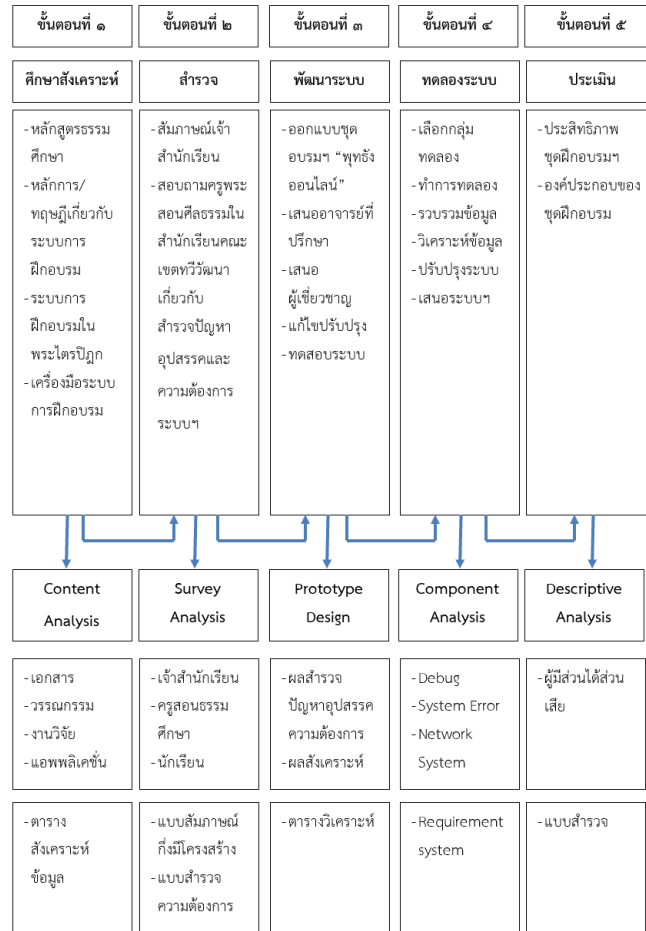
ภาพที่ ๓.๑ แสดงขั้นตอนในการดำเนินการวิจัย