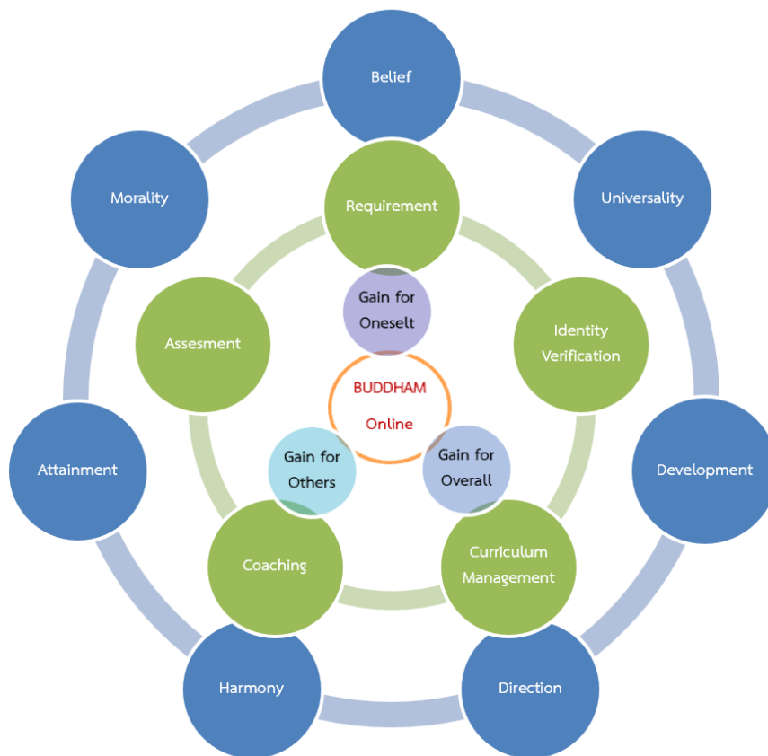
แผนภาพที่ 4.1 แสดงองค์ความรู้ที่ได้จากการวิจัยเรื่อง “ระบบการจัดการฝึกอบรมธรรมศึกษาผ่านแอปพลิเคชัน “พุทธัง ออนไลน์” สำหรับครูพระสอนศีลธรรม ในสำนักเรียนคณะเขตทวีวัฒนา กรุงเทพมหานคร”

จากผลการวิจัย สามารถสังเคราะห์องค์ความรู้ที่ได้จากการวิจัยเกี่ยวกับระบบการจัดการฝึกอบรมธรรมศึกษาผ่านแอปพลิเคชัน “พุทธัง ออนไลน์” สำหรับครูพระสอนศีลธรรมในสำนักเรียนคณะเขตทวีวัฒนา กรุงเทพมหานคร เป็น 7 รูปแบบ 5 ระบบ และ 3 เหตุผล ดังนี้