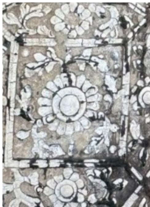
ภาพที่ 3 ลายดอกกลอยวัดทองทิพย์พัฒนาราม