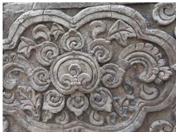
ภาพที่ 11 ลายใบไม้วัดป่าสัก