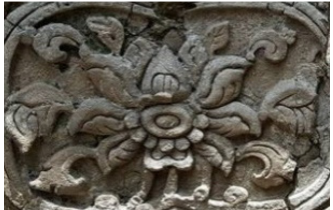
ภาพที่ 4 ลายดอกลอยวัดป่าสัก