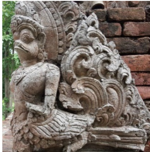
ภาพที่ 2 ลายกระหนกวัดป่าสัก