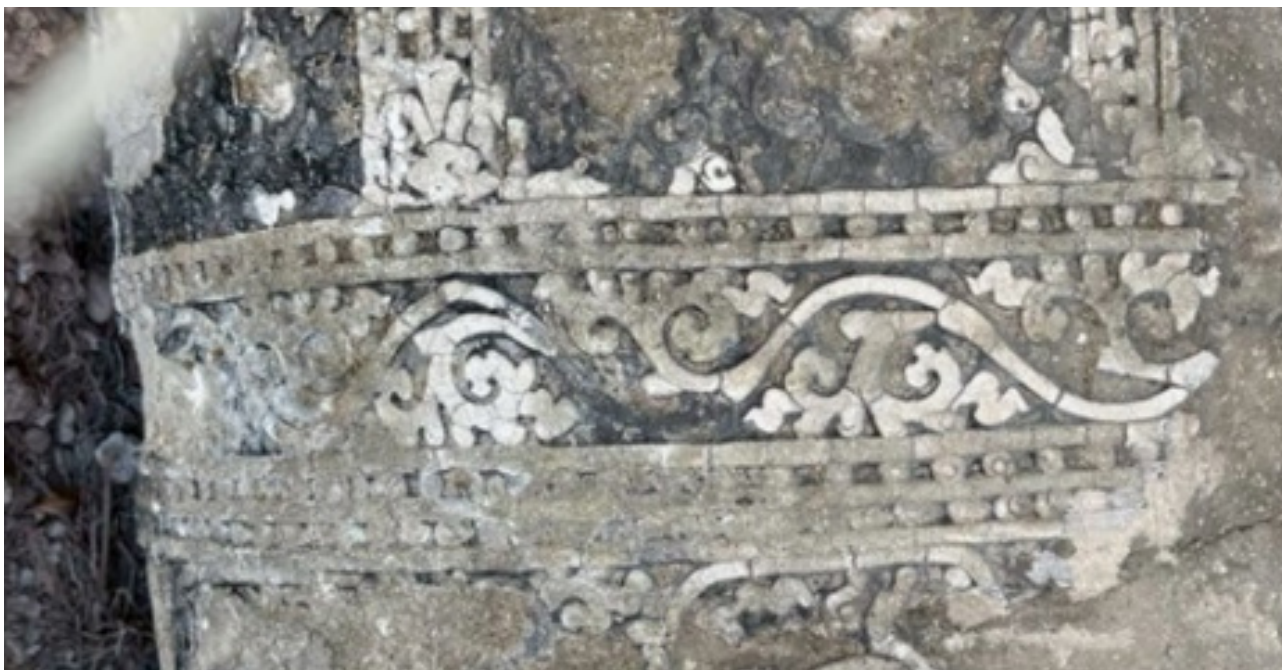
ภาพที่ 7 ลายดอกเครือเถากระหนกวัดทองทิพย์พัฒนาราม