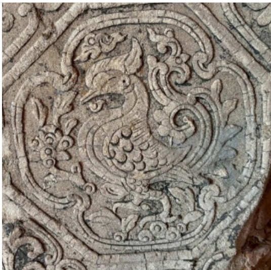
ภาพที่ 1 ลายกระหนกวัดสุวรรณสิริโพธิ์คำ

ส่วนกระหนกของวัดสุวรรณสิริโพธิ์คำมีความโปร่ง ตัวลายไม่ซับซ้อน ใช้เทคนิคการปั้นแปะชั้นเดียวไม่หนา เส้นของกระหนกแต่ละตัวมีความต่อเนื่องไหลลื่นกว่าของวัดป่าสัก