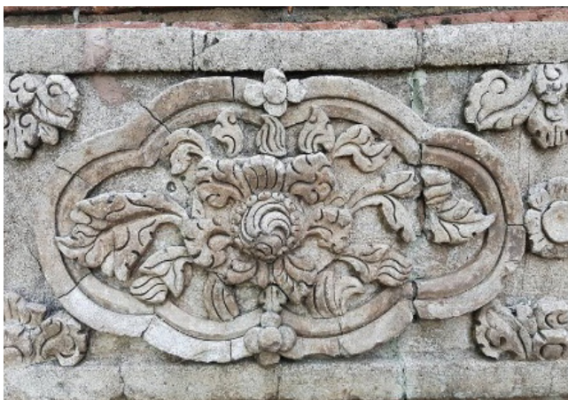
ภาพที่ 10 ลายใบไม้วัดป่าสัก