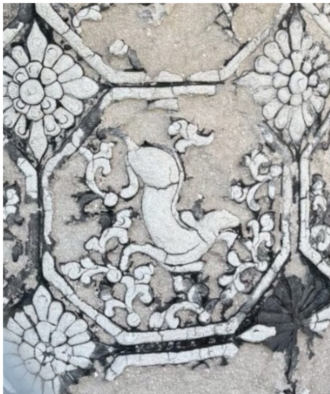
ภาพที่ 9 ลายใบไม้วัดทองทิพย์พัฒนาราม