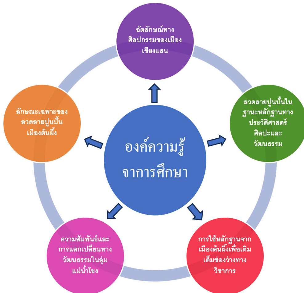
ภาพที่ 12 แผนภูมิรูปภาพองค์ความรู้จากการศึกษา

5. การใช้หลักฐานจากเมืองต้นฝั่งเพื่อเติมเต็มช่องว่างทางวิชาการ เนื่องจากหลักฐานลวดลายปูนปั้นของเมืองเชียงแสนในพุทธศตวรรษที่ 21 หลงเหลืออยู่ไม่มาก การนำลวดลายปูนปั้นจากเมืองต้นฝั่งมาใช้เป็นหลักฐานเทียบเคียง ช่วยเติมเต็มความเข้าใจเกี่ยวกับพัฒนาการทางศิลปกรรมล้านนาในช่วงเวลาดังกล่าว และเปิดมุมมองใหม่ในการศึกษาศิลปกรรมข้ามพรมแดน