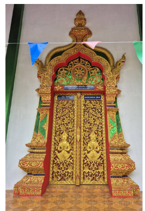
ภาพที่ 2 การสร้างสรรค์สืบทอดศิลปปะงานปูนปั้นของวัดในจังหวัดลำปาง

3. องค์ความรู้ด้านแนวทางการต่อยอด ศิลปะงานปูนปั้นกำลังเผชิญกับความท้าทายในการดำรงอยู่ แต่ในขณะเดียวกันก็มีศักยภาพในการต่อยอดเพื่อสร้างคุณค่าใหม่ในสังคมร่วมสมัย