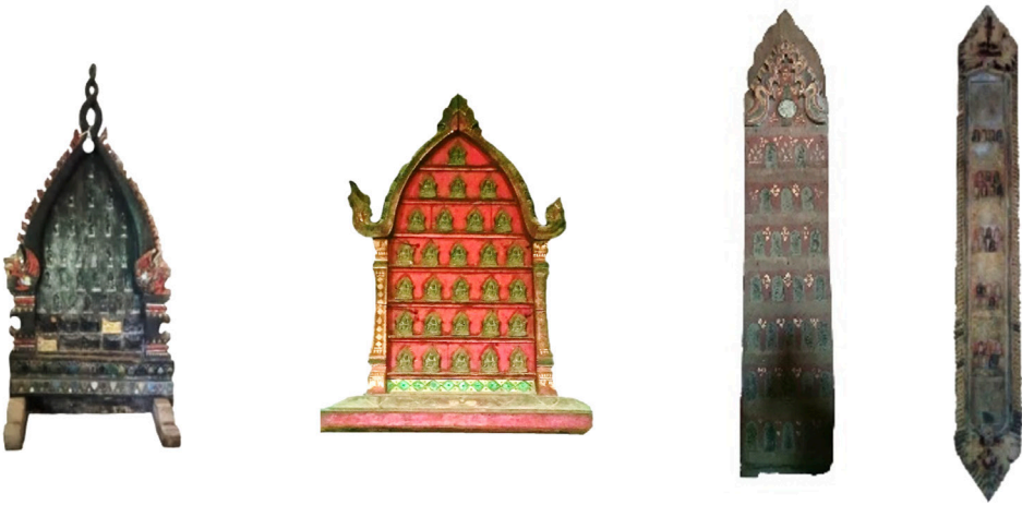
ภาพที่ 2 พระแผงไม้แบบซุ้มทรงเบ็ดเตล็ด กรอบซุ้มรูปนาค กรอบซุ้มบรรพแถลง และรูปแบบตุง

ออกลายเป็นลายดอกไม้ขนาดใหญ่ ประดับพระพิมพ์ประดับไว้เป็นกลุ่ม กลุ่มละ 7 องค์ จำนวน 4 กลุ่ม และมีกลุ่มละ 4 องค์ อีก 1 กลุ่ม รวมทั้งหมด 32 องค์