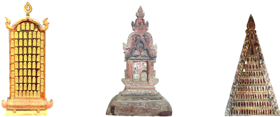
ภาพที่ 4 พระแผงไม้แบบทรงเรือนแก้ว ทรงกรอบโค้งมน ทรงปราสาท และกรอบสามเหลี่ยม