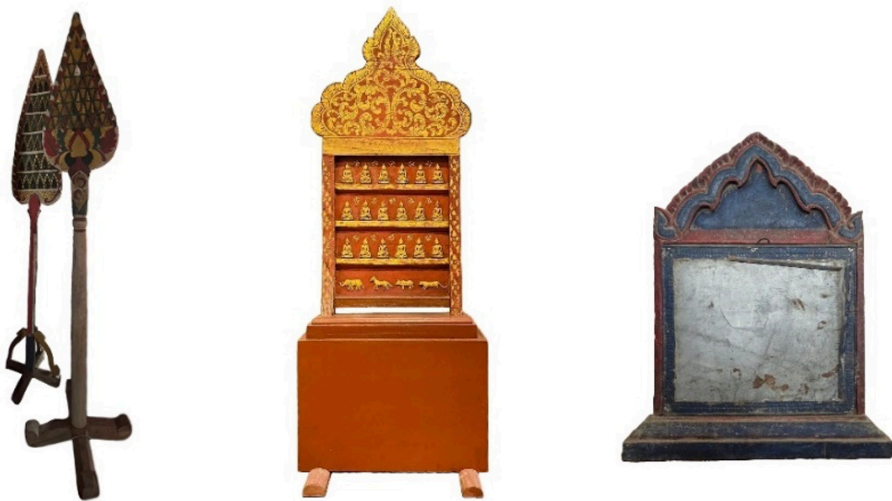
ภาพที่ 3 พระแผงไม้แบบกรอบกลีบบัว และทรงกรอบซุ้ม

คั่น ส่วนยอดอยู่ในโครงสร้างสามเหลี่ยม มียอดดอกบัวตูม ส่วนฐานเป็นฐานสี่เหลี่ยมสูงมาก ตกแต่งด้วยลายคำฉลุลายประดับพระพิมพ์ 18 องค์ ระหว่างพระพิมพ์แต่ละองค์ตกแต่งด้วยลายคำฉลุลายรูปดอกไม้ที่มีกลีบดอกวนไปทางขวาคล้ายกงจักร ส่วนยอดในกรอบซุ้มเขียนสีทองบนพื้นแดง เป็นลายเครือเถาที่มีใบและก้านขนาดใหญ่ตามแบบศิลปะไทใหญ่-พม่า ส่วนพระแผงไม้ในพิพิธภัณฑวัดลี แสดงรูปแบบกรอบรูปแบบกรอบใส่รูป โดยกรอบรูปสี่เหลี่ยมผืนผ้า ภายในกรอบกระจกไม่ปรากฏรูปพระพุทธรูปแล้ว เหนือกรอบรูปเป็นยอดซุ้มทรงบรรพท์ แฉลง ปลายซุ้มเป็นตัวหงา มีใบเพกา ฐานบัวคว่ำเดี่ยวๆ