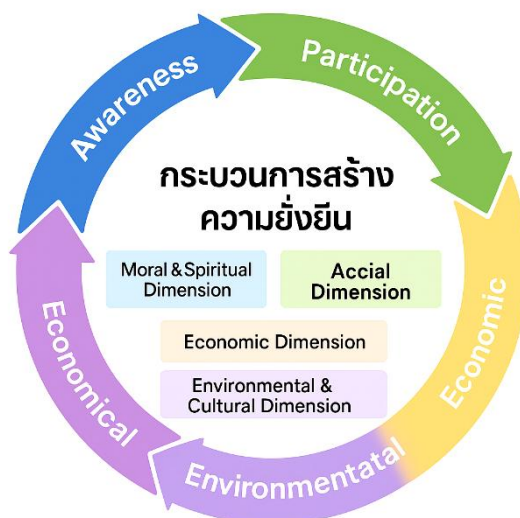
ภาพ 1 กระบวนการสร้างความยั่งยืน

1.5 ต้นแบบเบื้องต้นของรูปแบบ (Preliminary Model) ผลการสังเคราะห์ได้นำไปสู่การสร้างต้นแบบเบื้องต้นของการสร้างความยั่งยืน ซึ่งประกอบด้วย 3 ขั้นตอนหลัก 1) การสร้างจิตสำนึก (Moral Awareness) ปลูกฝังคุณธรรมพื้นฐานและสร้างแรงบันดาลใจให้กับคนในชุมชน 2) การขับเคลื่อนกิจกรรม (Community Engagement) จัดกิจกรรมและโครงการร่วมกันอย่างต่อเนื่อง เพื่อสร้างความรู้สึกร่วมเป็นเจ้าของ 3) การเสริมแรงและยกระดับพัฒนาศักยภาพผู้นำชุมชน ถ่ายทอดองค์ความรู้ สร้างเครือข่ายภายนอก และขยายผลสู่พื้นที่อื่น