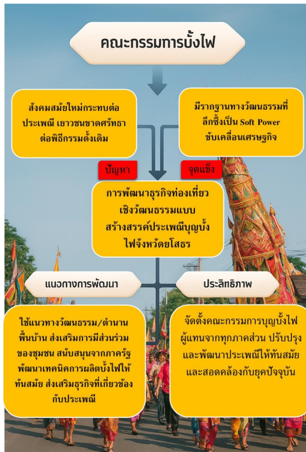
ภาพ 2 องค์ความรู้ที่ได้จากงานวิจัย

การวิจัยเรื่อง การพัฒนาธุรกิจท่องเที่ยวเชิงวัฒนธรรมแบบสร้างสรรค์ประเพณีบุญบั้งไฟจังหวัดยโสธร ที่ผู้วิจัยได้ดำเนินการวิเคราะห์และสังเคราะห์ผลการวิจัยเพื่อให้เกิดองค์ความรู้ใหม่ ผู้วิจัยจึงขอนำเสนอองค์ความรู้ใหม่อยู่ในรูปแผนภาพผังโน้ตทัศน์ดังภาพที่ 2