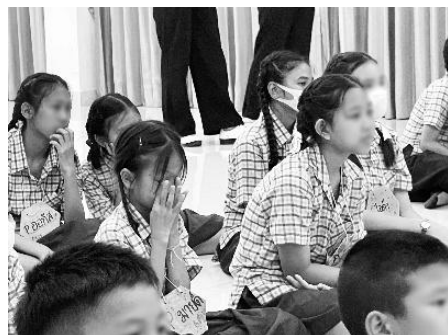
ภาพ 3 กิจกรรมหยุดคิดเมตตา