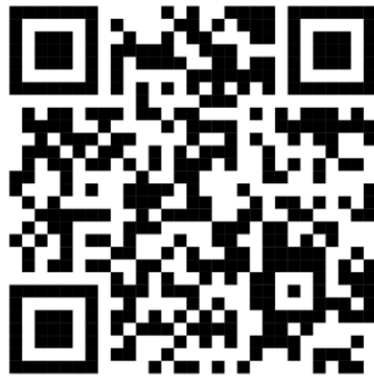
ภาพ 1 QR Code คู่มือกิจกรรม

3. ผลการถ่ายทอดกระบวนการแก้ไขปัญหาคารกั้นแก้งของนักเรียนชั้นประถมศึกษาในโรงเรียนวัดไร่ขิง (สุนทรอุทิศ)