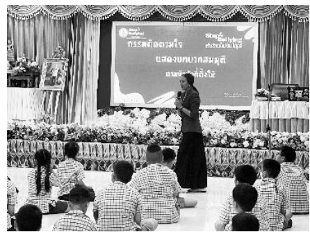
ภาพ 6 กิจกรรมสะท้อนผลของการกลั่นแกล้ง

กิจกรรมที่มีผลชัดเจน ได้แก่ ป้ายแห่งความยินดี ช่วยในการเสริมสร้างมูทิตาจิตให้เกิดขึ้น นักเรียนเริ่มแสดงความยินดีในความสำเร็จของกันและกัน ลดพฤติกรรมอิจฉา แข่งขัน หรือแสดงอำนาจเหนือกัน ขณะที่กิจกรรมกรรมติดตามใจทำให้นักเรียนหลายคนเกิดการสะท้อนคิดอย่างลึกซึ้งเกี่ยวกับผลของการกลั่นแกล้ง และเข้าใจว่าความรู้สึกเจ็บปวดที่ตนเองเคยสร้างให้ผู้อื่นนั้นย้อนกลับมา มีผลต่อความรู้สึกของตนเองอย่างไร จนทำให้เกิดภาพจำและไม่คิดที่อยากกลั่นแกล้งผู้อื่นอีก การดำเนินกิจกรรมทดลองภายใต้แนวทางการแก้ไขปัญหาคารกัณณ์แกล้งแนวพุทธ ทำให้เห็นผลลัพธ์ในเชิงคุณภาพที่ชัดเจน ทั้งในด้านพฤติกรรม ทักษะคิด และบรรยากาศของชั้นเรียน โดยเฉพาะอย่างยิ่งในด้านการพัฒนาจิตใจของนักเรียนให้มีความกรุณา ยินดีในความสำเร็จของผู้อื่น และสามารถควบคุมอารมณ์ในสถานการณ์ที่ท้าทายได้ดีขึ้น ซึ่งถือเป็นรากฐานสำคัญในการสร้างโรงเรียนที่ปลอดจากความรุนแรง และเป็นพื้นที่แห่งการเรียนรู้อย่างแท้จริง