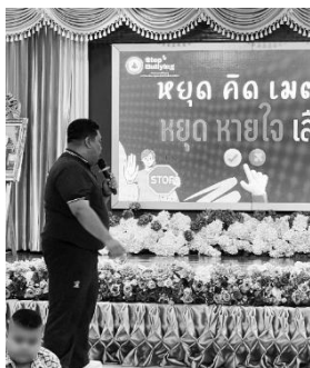
ภาพ 2 กิจกรรมหยุดคิดเมตตา

3.1 กิจกรรม “หยุด...คิด...เมตตา” มีวัตถุประสงค์ เพื่อให้ผู้เรียนรู้จักใช้ “สติ” หยุดพฤติกรรมการกั้นแก้งก่อนเกิดขึ้น เพื่อส่งเสริมการรู้จักตนเอง เข้าใจอารมณ์ และความรู้สึกของผู้อื่น และเพื่อปลูกฝังความเมตตาต่อเพื่อนการสังเกตการณ์ที่ได้จากกิจกรรม “หยุด...คิด...เมตตา” ได้รับการออกแบบเพื่อพัฒนาทักษะทางอารมณ์และจิตใจของนักเรียนชั้นประถมศึกษา ผ่านการเรียนรู้ที่เน้นประสบการณ์ตรงและการสะท้อนความรู้สึก ผลจากการสังเกตการณ์ระหว่างและหลังการจัดกิจกรรม พบว่า พฤติกรรมและทัศนคติของนักเรียนเปลี่ยนแปลงในเชิงบวกอย่างน่าสนใจ นักเรียนเริ่มมีพฤติกรรมหยุดคิดก่อนจะกระทำสิ่งใดที่อาจส่งผลกระทบต่อผู้อื่น โดยเฉพาะในสถานการณ์ที่อารมณ์เริ่มรุนแรงหรือเมื่อเกิดความไม่พอใจต่อเพื่อน สิ่งนี้สะท้อนถึงการเริ่มต้นพัฒนาการใช้ สติ ซึ่งเป็นเป้าหมายหลักของกิจกรรม เด็กหลายคนแสดงให้เห็นถึงความสามารถในการยับยั้งตนเอง รู้จักควบคุมอารมณ์ และเลือกใช้คำพูดหรือการกระทำที่ไม่รุนแรง ทั้งยังมีการอธิบายเหตุผลประกอบพฤติกรรม ได้แก่ “เพราะเราไม่อยากให้เพื่อนเสียใจ” หรือ “ถ้าเป็นเรา เราก็ไม่อยากโดนพูดแบบนั้น” ซึ่งเป็นตัวอย่างของการเริ่มเข้าใจความรู้สึกของผู้อื่น