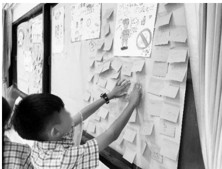
ภาพ 4 กิจกรรมป้ายแห่งความดี

มีวัตถุประสงค์ เพื่อให้ให้นักเรียนเข้าใจความหมายและความสำคัญของ “กรุณา” เพื่อส่งเสริมพฤติกรรมช่วยเหลือซึ่งกันและกันในชีวิตประจำวัน เพื่อสร้างบรรยากาศที่อบอุ่น ปลอดภัย และปราศจากการกลั่นแกล้ง เพื่อให้นักเรียนเห็นความสำคัญของการให้โดยไม่หวังผลตอบแทน และเพื่อกระตุ้นให้นักเรียนพัฒนาทักษะทางสังคม และความเห็นอกเห็นใจ จากการสังเกตการณ์ในระหว่างการดำเนินกิจกรรม พบว่า นักเรียนเริ่มแสดงออกถึงพฤติกรรมที่แฝงด้วยน้ำใจ ความห่วงใย และความร่วมมืออย่างชัดเจนในช่วงแรกของกิจกรรม นักเรียนหลายคนแสดงความลังเลในการเข้าช่วยเหลือผู้อื่น โดยเฉพาะในกรณีที่ไม่ได้สนิทกับเพื่อนคนนั้น