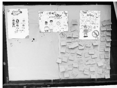
ภาพ 5 กิจกรรมมุมมองที่แตกต่าง

3.3 กิจกรรม “ป้ายแห่งความยินดี” มีวัตถุประสงค์ เพื่อปลูกฝังแนวคิดเรื่องมูทิตา ให้กับนักเรียน เพื่อส่งเสริมให้นักเรียนรู้จักการแสดงออกเชิงบวก เพื่อสร้างบรรยากาศในห้องเรียนที่เต็มไปด้วยกำลังใจและมิตรภาพ เพื่อช่วยให้นักเรียนตระหนักถึงความสำเร็จของตนเองและผู้อื่น และเพื่อกระตุ้นให้นักเรียนพัฒนานิสัยในการให้กำลังใจและส่งเสริมกัน จากการสังเกตการณ์พบว่า เด็กนักเรียนส่วนใหญ่ให้ความสนใจและมีท่าทีเปิดใจมากขึ้นเมื่อเห็นเพื่อน ๆ ได้รับการชื่นชม หลายคนเริ่มมีความกล้าในการแสดงออกเชิงบวก และรู้สึกดีเมื่อได้รับคำยินดีจากเพื่อน ซึ่งส่งผลให้บรรยากาศในชั้นเรียนเปลี่ยนแปลงไปในทิศทางที่อบอุ่นและเต็มไปด้วยพลังบวก นักเรียนแสดงออกด้วยรอยยิ้ม การปรบมือ หรือการเขียนข้อความให้กำลังใจแก่กันอย่างเป็นธรรมชาติ