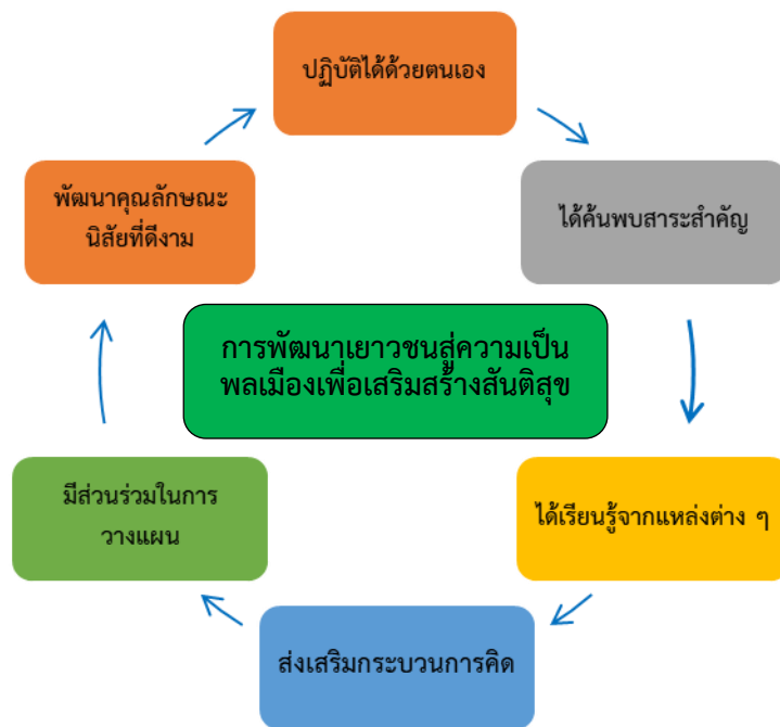
ภาพ 2 แสดงองค์ความรู้จากการวิจัย

จากการศึกษาวิจัยเรื่อง การพัฒนาเยาวชนสู่ความเป็นพลเมืองเพื่อเสริมสร้างสันติสุขใน ตำบลเวียง อำเภอเชียงคำ จังหวัดพะเยา ผู้วิจัยสรุปองค์ความรู้ที่ได้ ดังภาพที่ 2